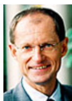
Bürgermeister Ulrich Roland